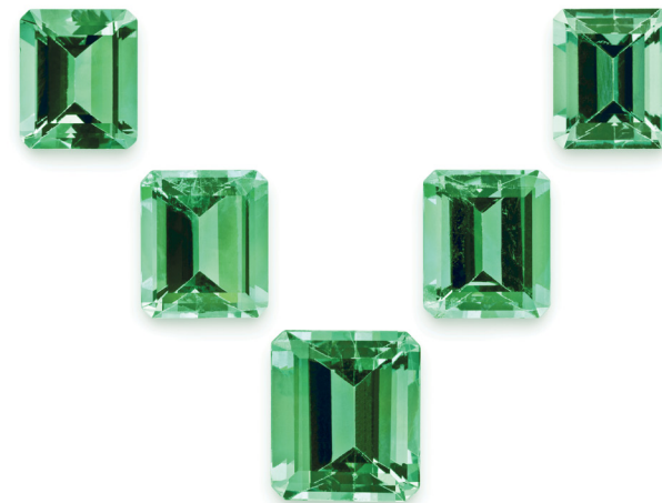
— кольцо (браслет) «Чивор» массой 13,52 карат

Основные месторождения изумрудов находятся в Колумбии (Мусо, Чивор, Коскуэс). Здесь добывается до 70% мирового экспорта изумрудов отменного качества и цвета, и именно отсюда мы привозим камни для вас.