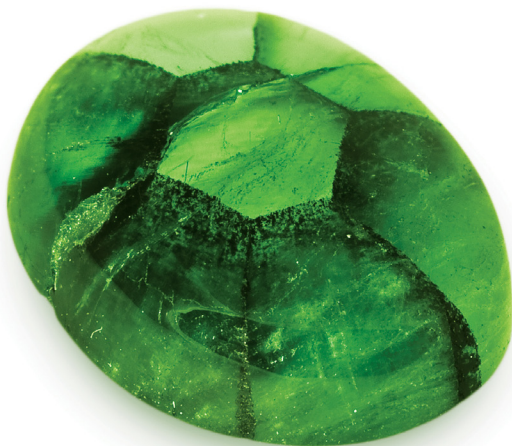
— изумруд «Трапиче» массой 6,41 карат

Камни отбираются непосредственно на месторождении настоящими профессионалами своего дела с многолетним практическим опытом.